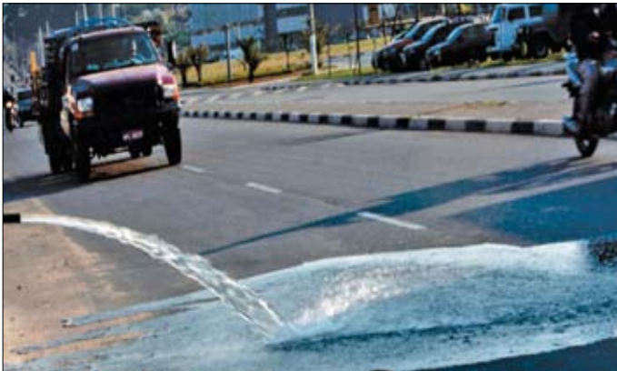
Figura 1 - Pavimento praticamente impermeável. Verifica-se a rápida formação de escoamento superficial da água.

Nos pavimentos convencionais durante uma chuva rapidamente há formação de escoamento superficial de água. Este volume de água vai demandar o sistema de drenagem urbana do município, que pode saturar e assim ocasionar enchentes (Figura 1).