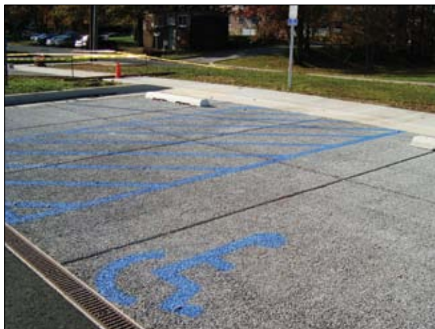
Figura 5 - Pavimento de concreto permeável

O concreto permeável possui alta porosidade devido à presença de poros interconectados. Para isso, limita-se o teor de finos no traço do concreto e a pasta de cimento é responsável por garantir a interconectividade dos vazios.