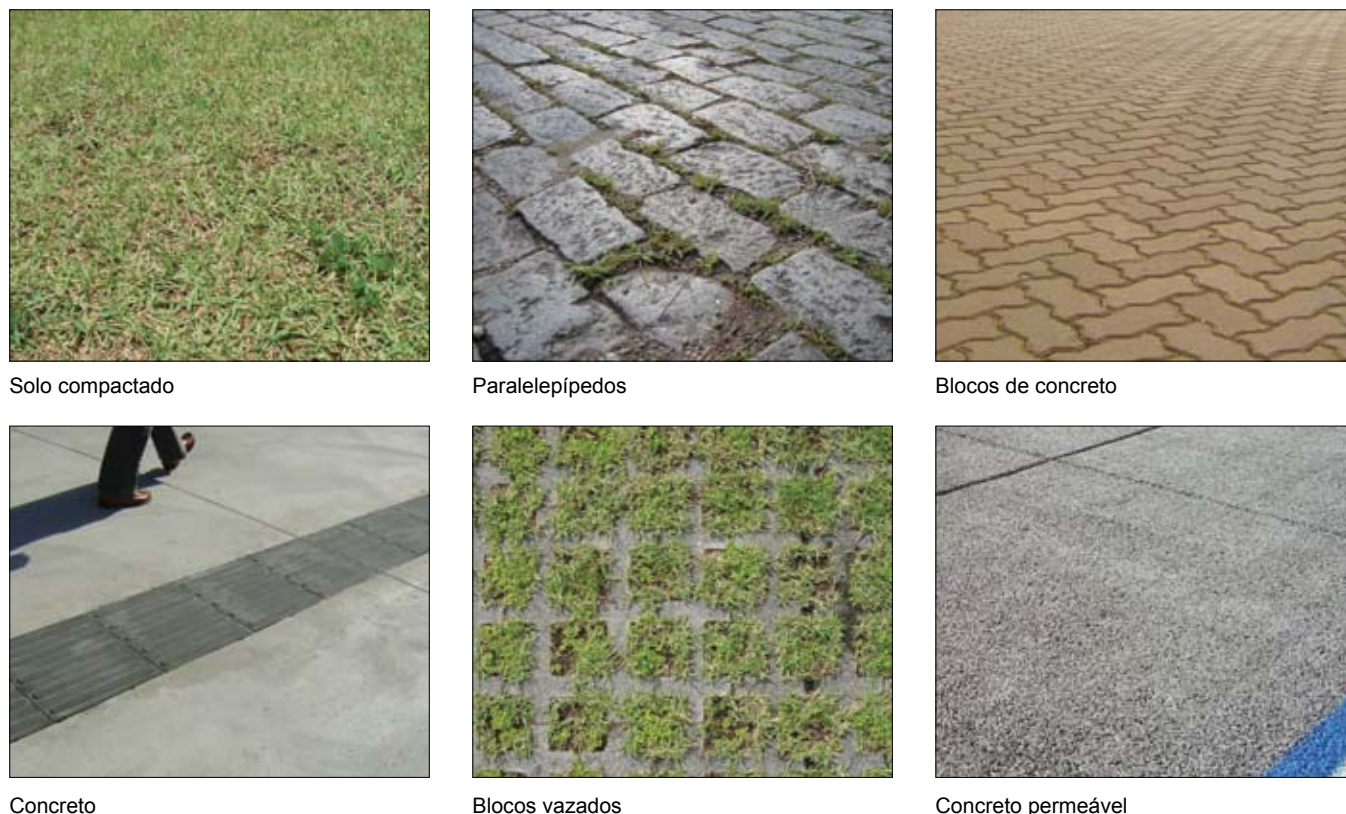
Figura 4 – Superfícies avaliadas em relação ao escoamento superficial - Adaptado (ARAÚJO, 1999).

0,05 a 0,20, pois o solo compactado e a ausência de depressões e vegetação aumentam o volume de água escoado superficialmente. Este fato pode ser observado em um estudo realizado pela Universidade Federal do Rio Grande do Sul (ARAÚJO, 1999) onde foi simulada chuva em diferentes tipos de superfícies (Figura 4) e registrado o escoamento superficial.