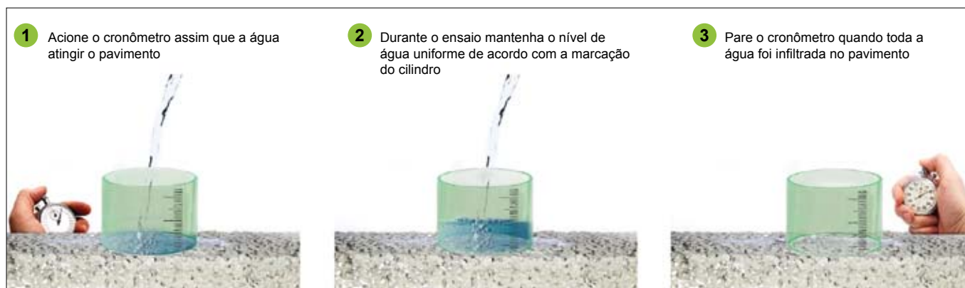
Figura 7 - Esquema para medição de coeficiente de permeabilidade in situ .

O método também pode ser utilizado para aprovação do pavimento após sua execução e no monitoramento ao longo da utilização do pavimento, podendo ser utilizado para definir a necessidade de limpeza e manutenção.