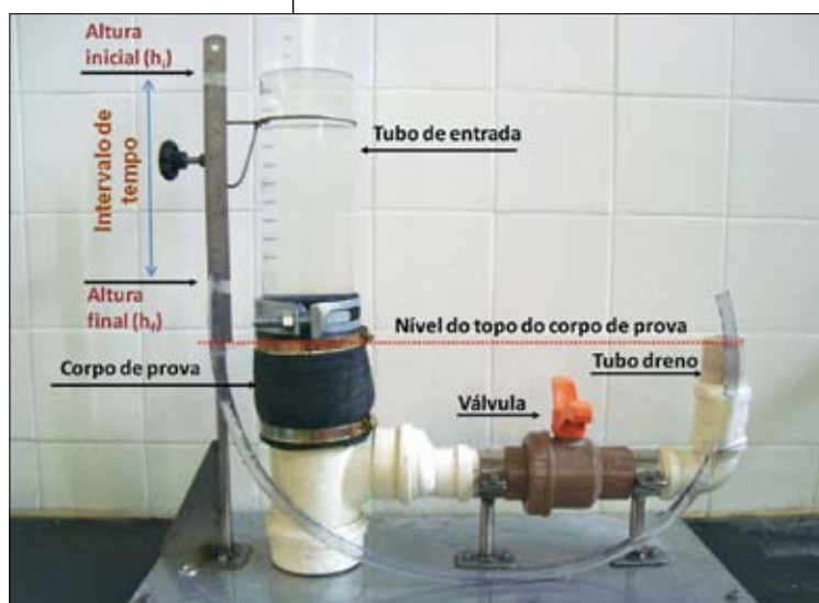
Figura 6 - Permeâmetro de carga variável para determinação do coeficiente de permeabilidade do concreto permeável

Após a instalação, o circuito é aberto permitindo-se a passagem de água através da amostra de concreto permeável até o dreno, saturando-a e garantindo a retirada do ar.